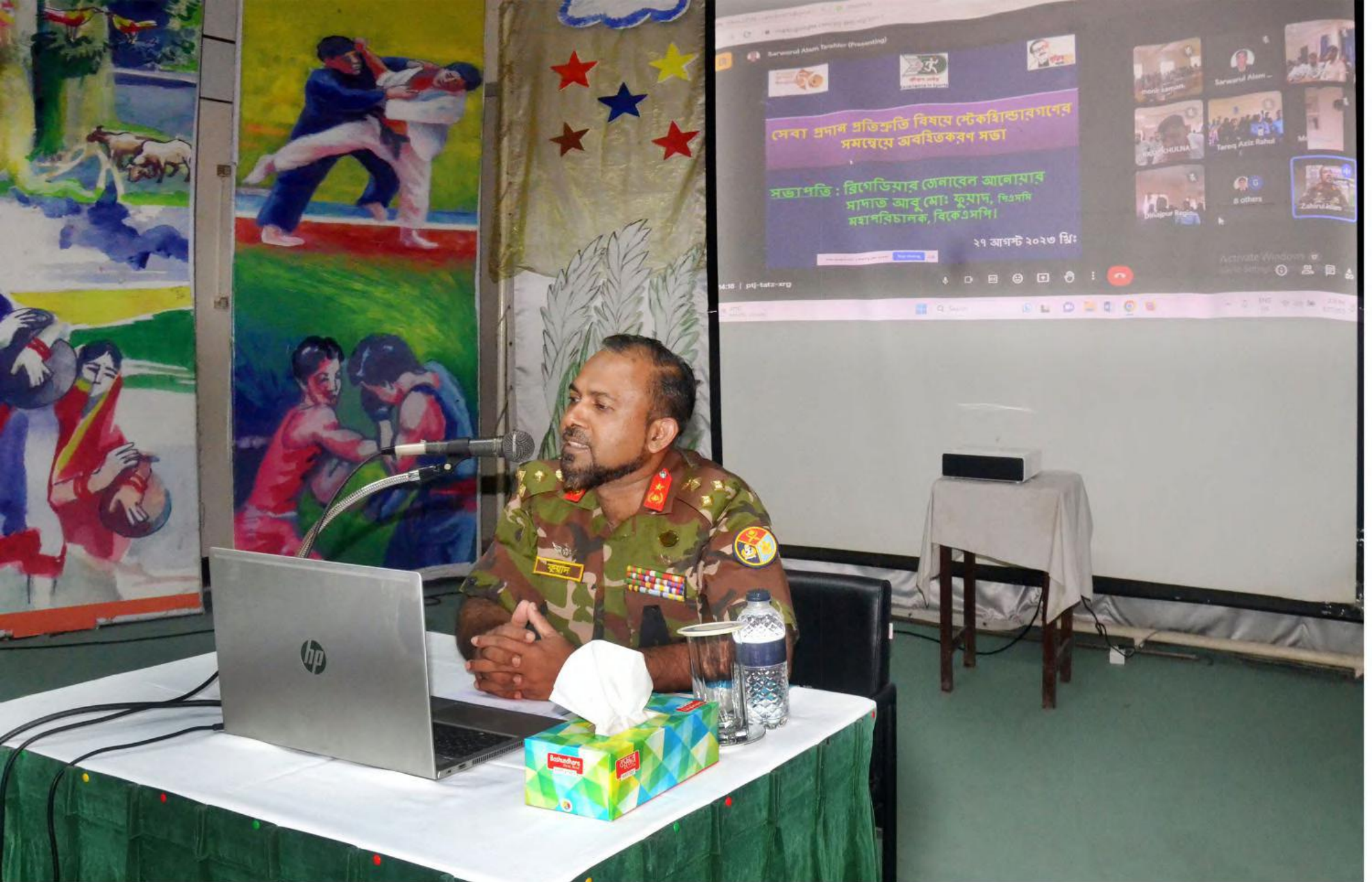
সেবা প্রদান প্রতিশ্রুতি বিষয়ে অংশীজনের সমন্বয়ে অবহিতকরণ সভা ২০২৩ এর বিকেএসপি'র সর্বস্তরের কর্মকর্তা-কর্মচারীদের সাথে মহাপরিচালক মহোদয়ের মতবিনিময়। তারিখঃ ২৭/০৮/২০২৩খ্রিঃ।