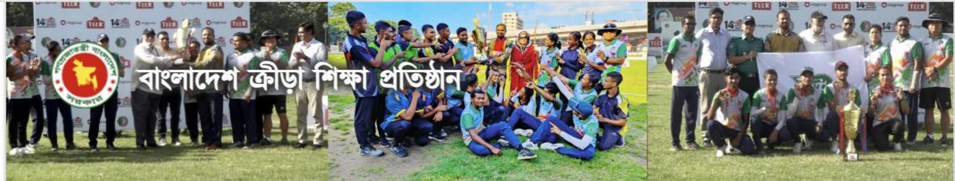
তীর ১৪৩ম জাতীয় অ্যাচারি চ্যাম্পিয়নশীপস্-২০২৩ এর রানার্স-আপ বিকেএসপি দলের সাথে মহাপরিচালক ।